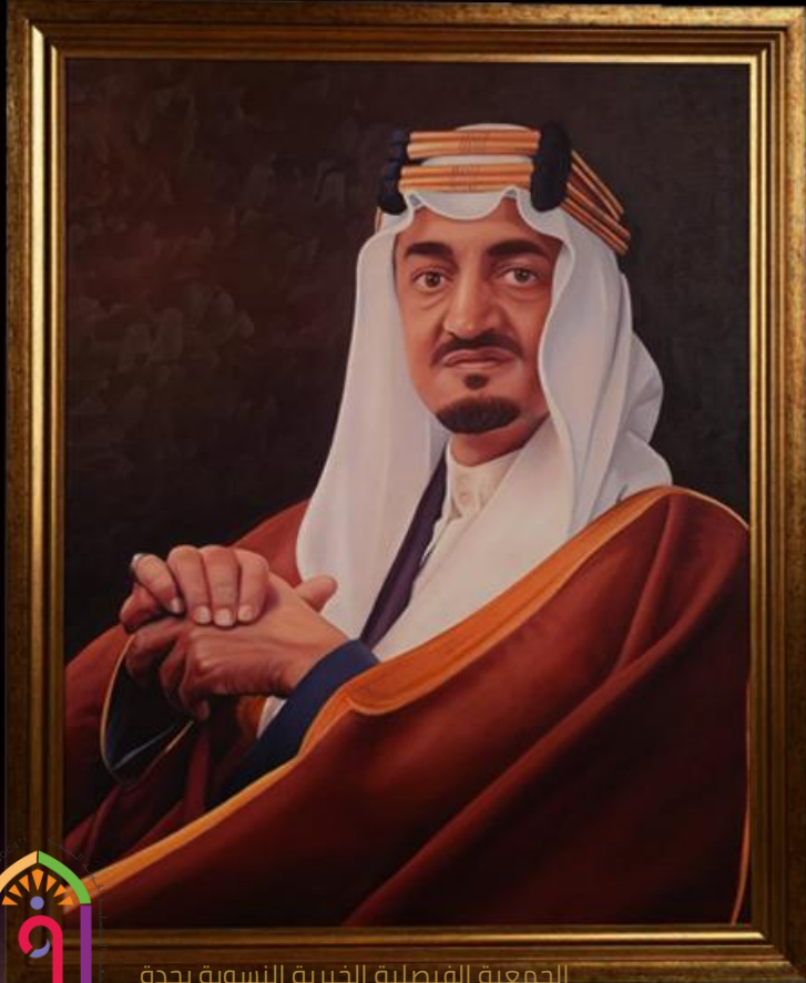
الجمعية الفيصلية الخيرية النسوية بجدة

سُمّيت الجمعية الفيصلية بهذا الاسم تليدًا لذكرى الراحل صاحب الجلالة الملك فيصل بن عبد العزيز آل سعود - رحمه الله - ثالث ملوك المملكة العربية السعودية، الذي توفي في 26 مارس 1975م، وهو التاريخ الذي تزامن مع تأسيس الجمعية في 30 مارس 1975م.