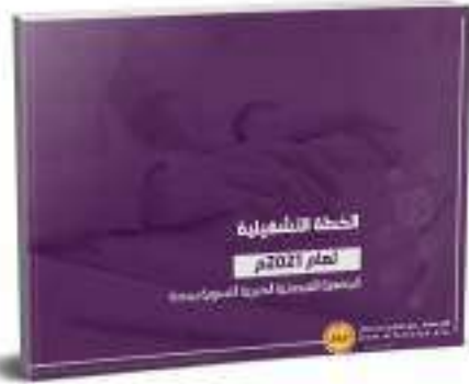
الخطة التشغيلية 2021م