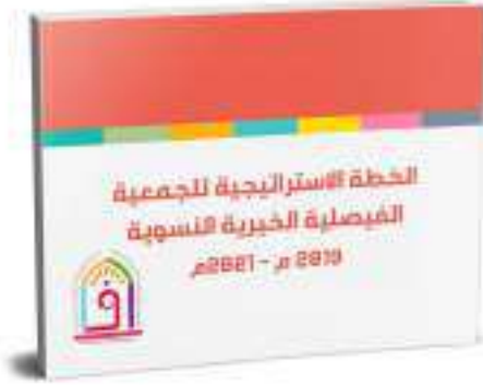
الخطة الاستراتيجية 2019م - 2021م