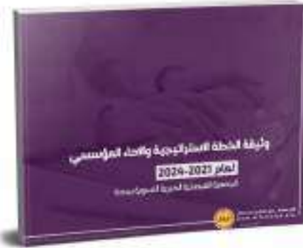
الخطة الاستراتيجية 2021 - 2024م