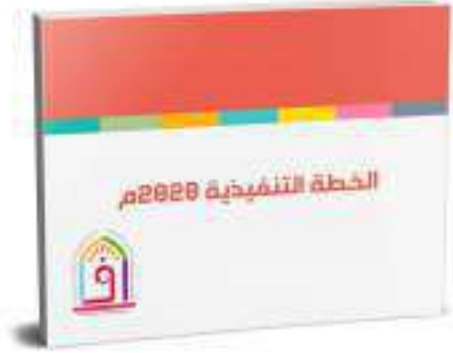
الخطة التنفيذية 2020م