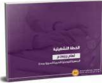
الخطة التشغيلية 2022م