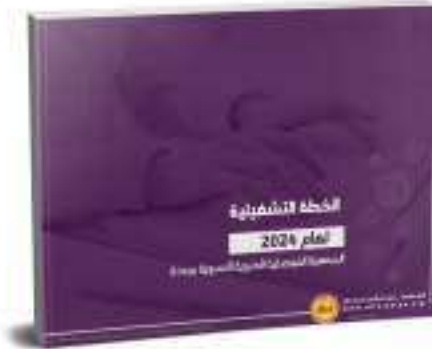
الخطة التشغيلية 2024